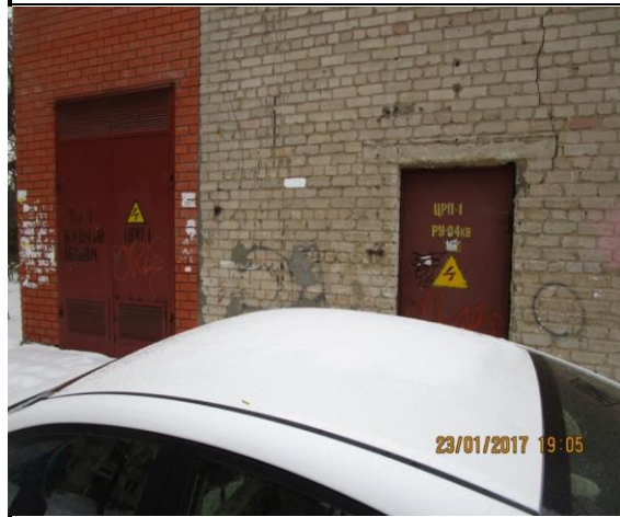
Внешний вид ТП