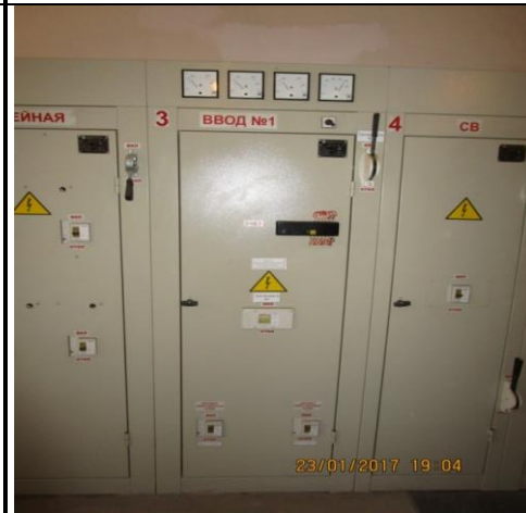
Место подключения ПЭС в ТП